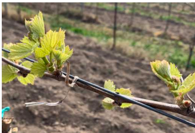
Chardonnay zona sud

L'abbassamento di temperature degli ultimi giorni ha rallentato, ed in alcuni casi bloccato, lo sviluppo fenologico ed i germogliamenti. Tuttavia nelle aree più calde le varietà più precoci hanno avuto un avanzamento nello stadio vegetativo.