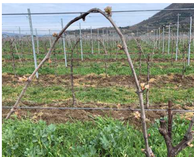
Glera zona oves

Sulla varietà glera, ad oggi è possibile osservare un germogliamento mediamente molto regolare.